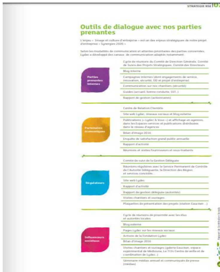
Extrait du rapport de contribution sociale, sociétale et environnementale de Lydec, page 43