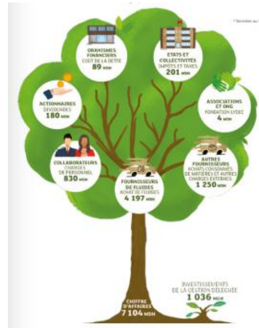
Extrait du premier rapport de contribution sociale, sociétale et environnementale de Lydec, page 25

Ces données s'appuient principalement sur les données financières publiées par Lydec ainsi que sur les informations fournies par les systèmes de reporting internes (reporting achats, RH et Fondation Lydec).