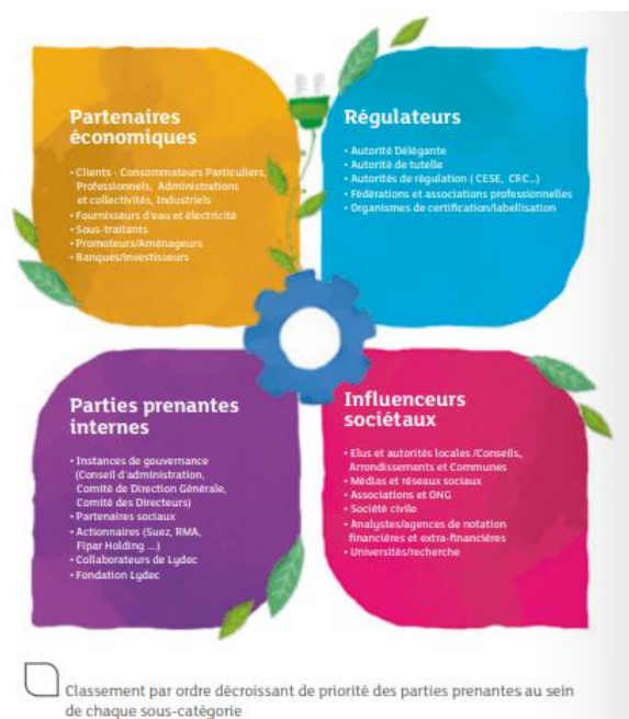
Extrait du premier rapport de contribution sociale, sociétale et environnementale de Lydec, page 42

Ce projet nous a amenés dans un premier temps à dresser une cartographie fine de nos parties prenantes en avril 2016, à travers un exercice de priorisation de nos parties prenantes au regard des trois éléments de criticité (pouvoir, urgence et légitimité).